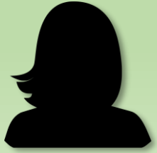
Administratrice Poste à pourvoir